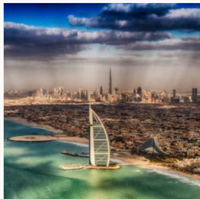
UAE TRAVEL INDUSTRY RICHIESTA PREVENTIVO