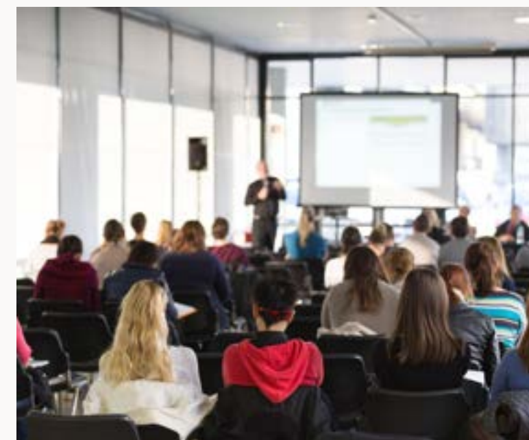
CORSI DI FORMAZIONE E WORKSHOP