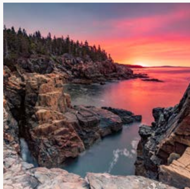
USA TRAVEL INDUSTRY RICHIESTA PREVENTIVO