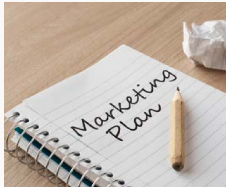
PIANI DI MARKETING