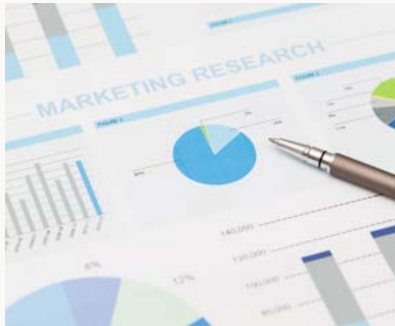
RICERCHE DI MERCATO