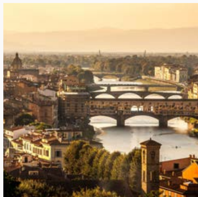
ITALIA TRAVEL INDUSTRY RICHIESTA PREVENTIVO