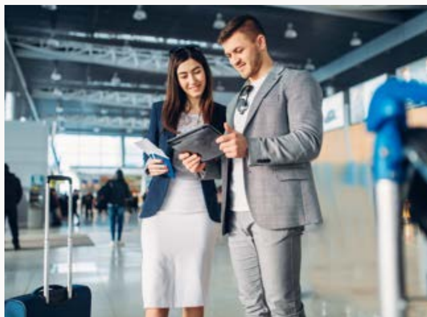
VIAGGI DI FAMILIARIZZAZIONE