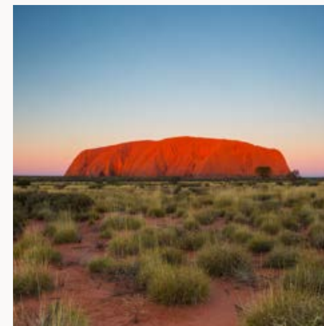
AUSTRALIA TRAVEL INDUSTRY RICHIESTA PREVENTIVO

PER APRIRE IL FORM SCEGLI IL TUO PAESE DI RESIDENZA E CLICCA SU RICHIESTA PREVENTIVO