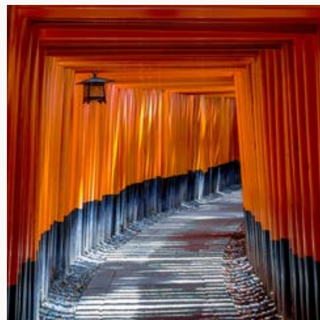
GIAPPONE TRAVEL INDUSTRY RICHIESTA PREVENTIVO