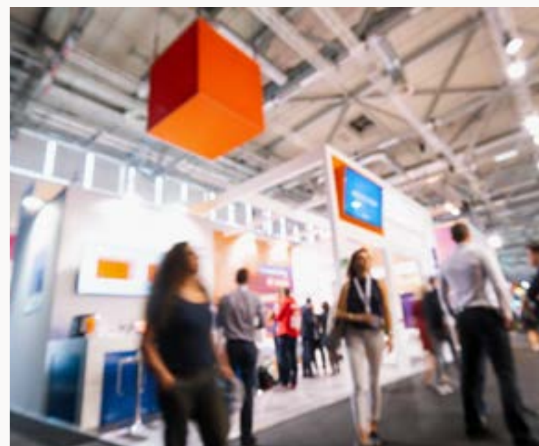
FIERE, TRADE, CONSUMER SHOWS