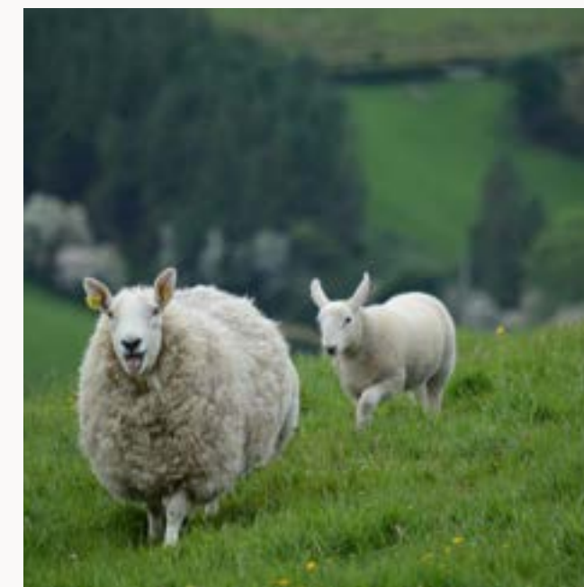
IRLANDA TRAVEL INDUSTRY RICHIESTA PREVENTIVO