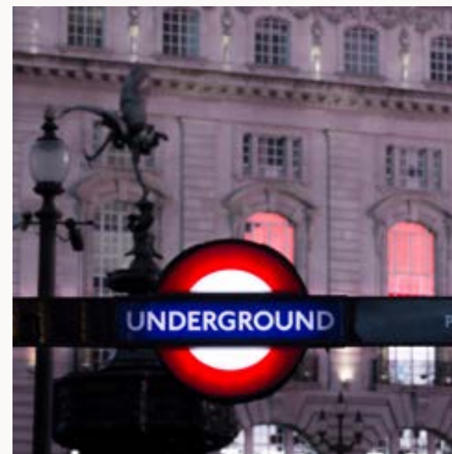
UK TRAVEL INDUSTRY RICHIESTA PREVENTIVO